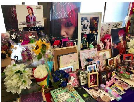
Figure 2: hideho památník

Toto místo jsem si vybrala, protože se v něm nachází památník mého oblíbeného kytaristy Hideto Matsumoto, který je lépe známý jako hide. Ten měl zde v roce 1998 pohřební ceremonii.